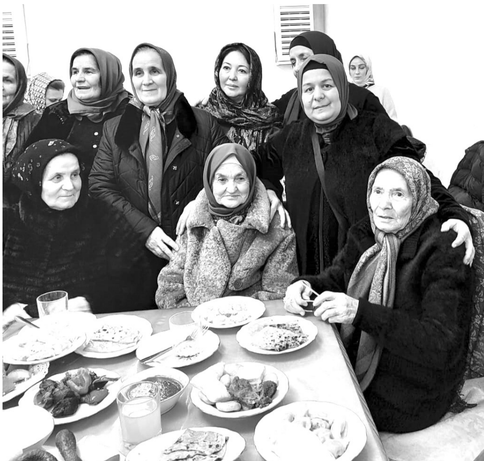
(Продолжение. Начало на стр.2)

О чем она думала? Об отце, который сгинул в заточении? О матери, умершей в Киргизской больнице? О братьях и сестрах, ушедших в мир иной, не дождавись ее?..